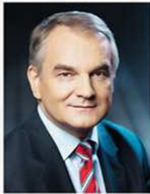
WALDEMAR PAWLAK Poseł na Sejm RP, Prezes Fundacji Polski Kongres Gospodarczy