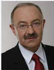
MIECZYŚLAW KASPRZAK Były wiceminister gospodarki, poseł na Sejm RP