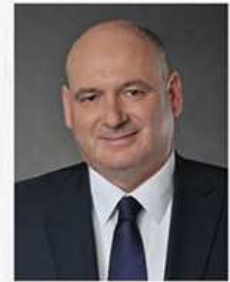
PIOTR ZGORZELSKI Poseł na Sejm RP, przewodniczący Komisji Samorządu Terytorialnego i Polityki Regionalnej