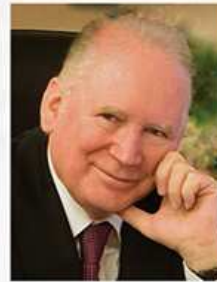
Prof. dr hab. inż. MACIEJ NOWICKI wiceprzewodniczący Rady Nadzorczej NFOŚiGW, b. minister środowiska