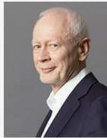
MICHAŁ BONI Poseł VIII kadencji do Parlamentu Europejskiego